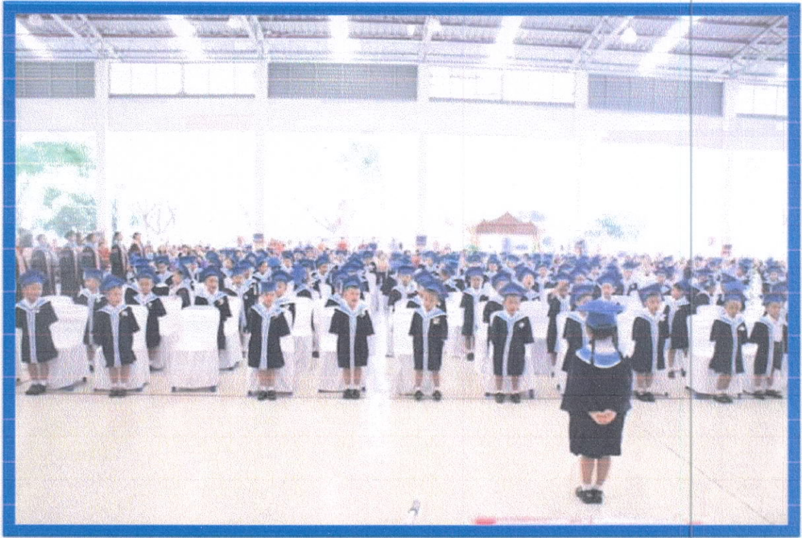
ยุวบัณฑิตร่วมกันร้องเพลงอนุบาลรำลึก