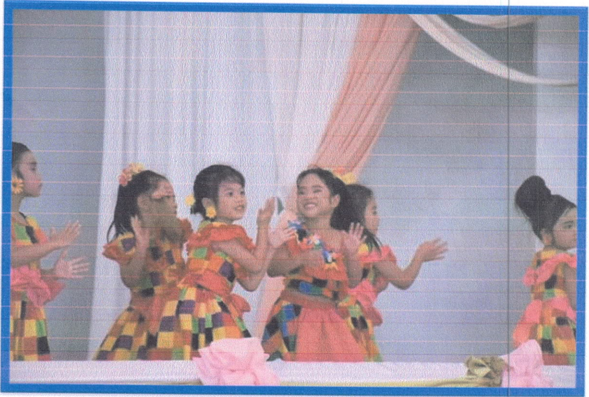
การแสดงของน้องอนุบาล 1 Love love kindergarten 1