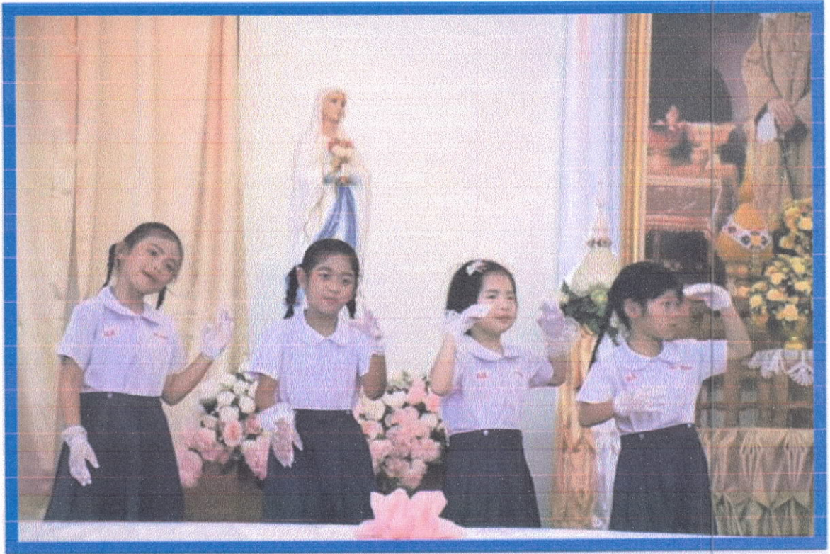
การแสดงของน้องอนุบาล 2 My friend