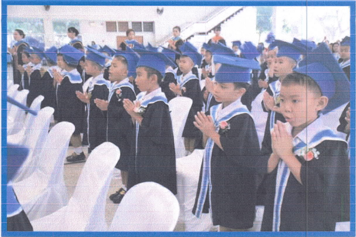
ยุวบัณฑิตร้องเพลงใครรักเราเท่าแม่