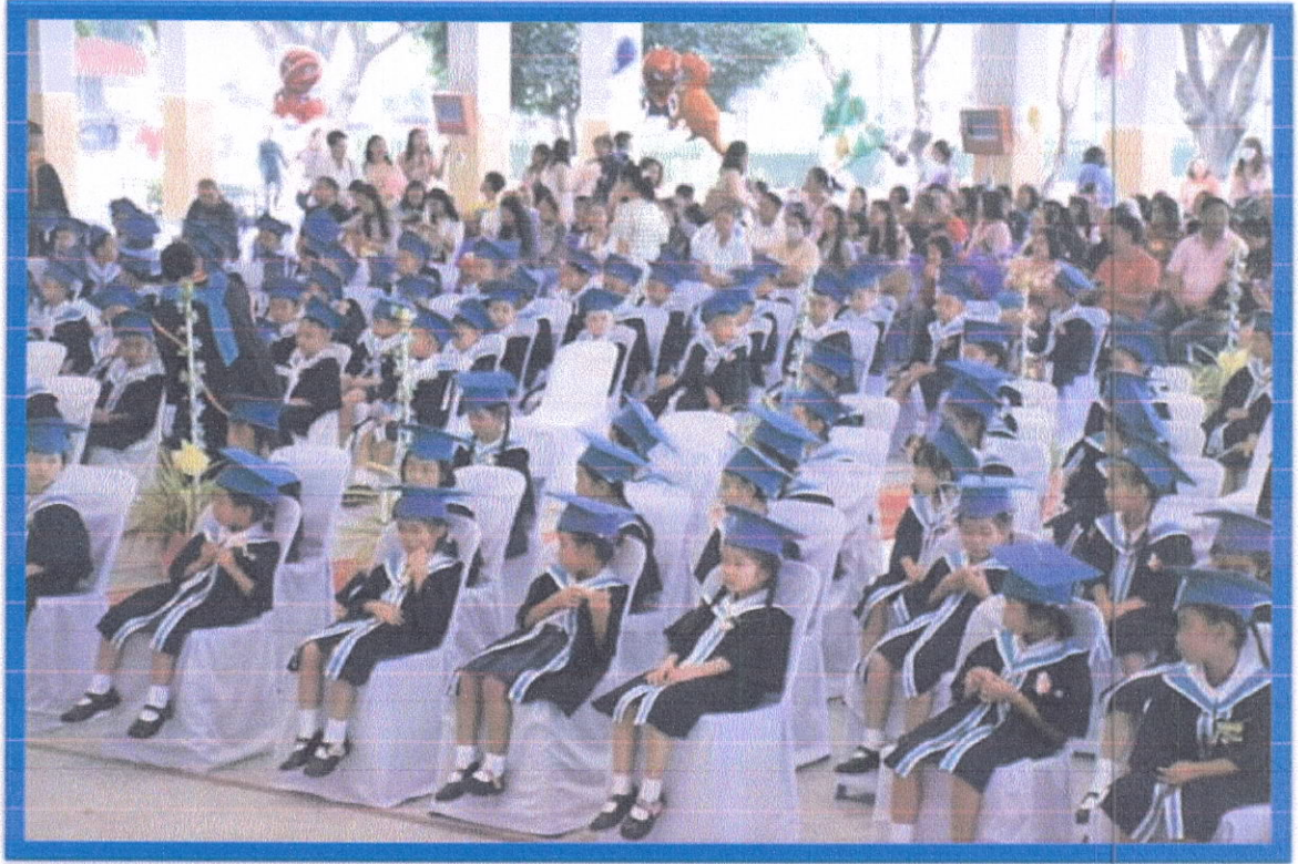
ยวบัณฑิตนั่งในเมรีโดม