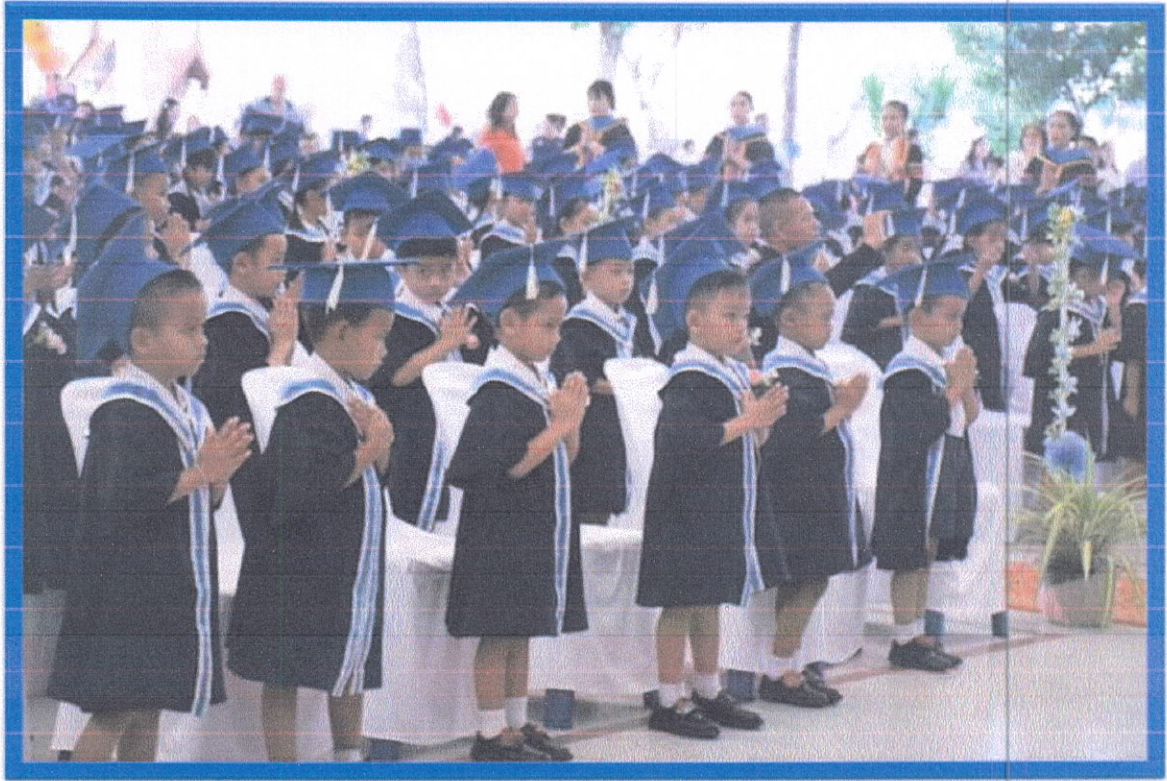
ยุวบัณฑิตทำท่าทางประกอบเพลงอัตลักษณ์ 4