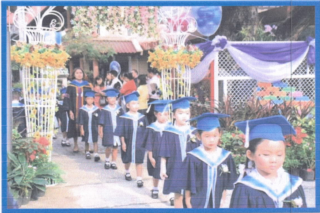
ยุวบัณฑิตเดินเป็นแถวเข้าสู่เมร์โตม