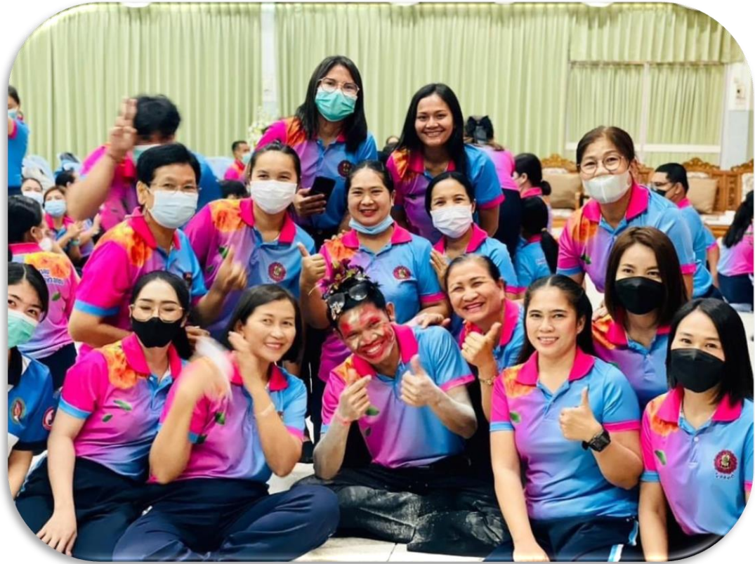
Teamwork Rejection Activity 3 : We are One