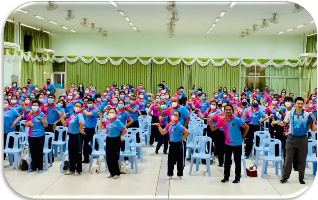
Teamwork Rejection Activity 1 : I Can Make It Better