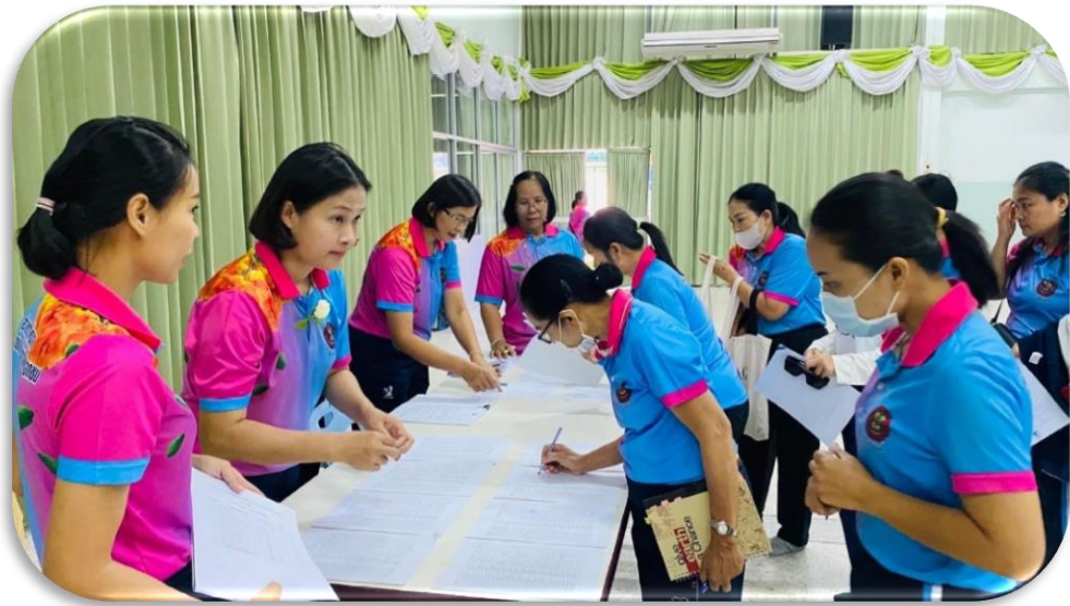
ลงทะเบียนการอบรม“การทำงานเป็นทีม(One Team One Mission)”