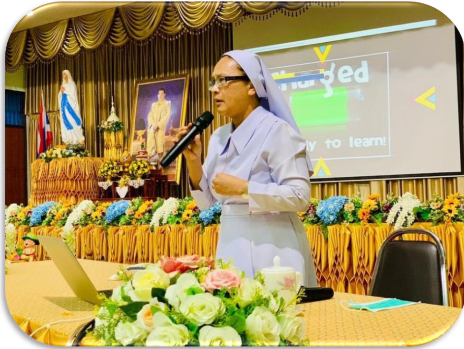
ปลูกฝังพัฒนาตนเองและโรงเรียนตามแนวคิด “We are on the same page”