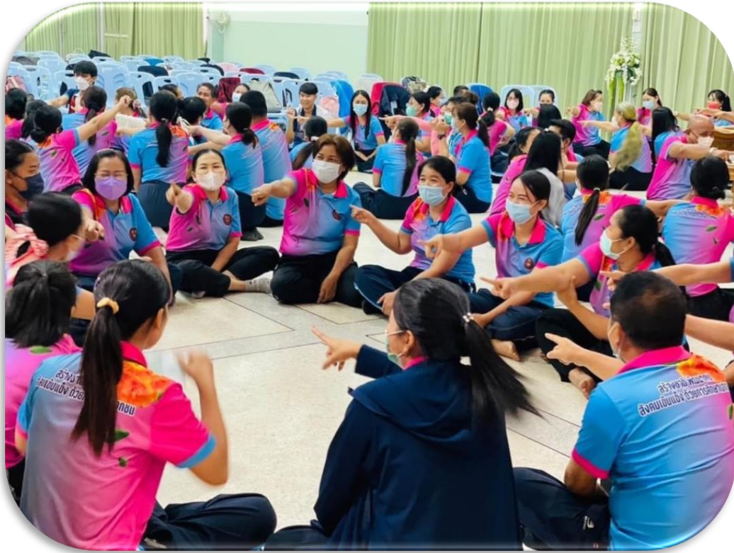
Teamwork Rejection Activity 2 : ไม่แก้ก ไม่กัก