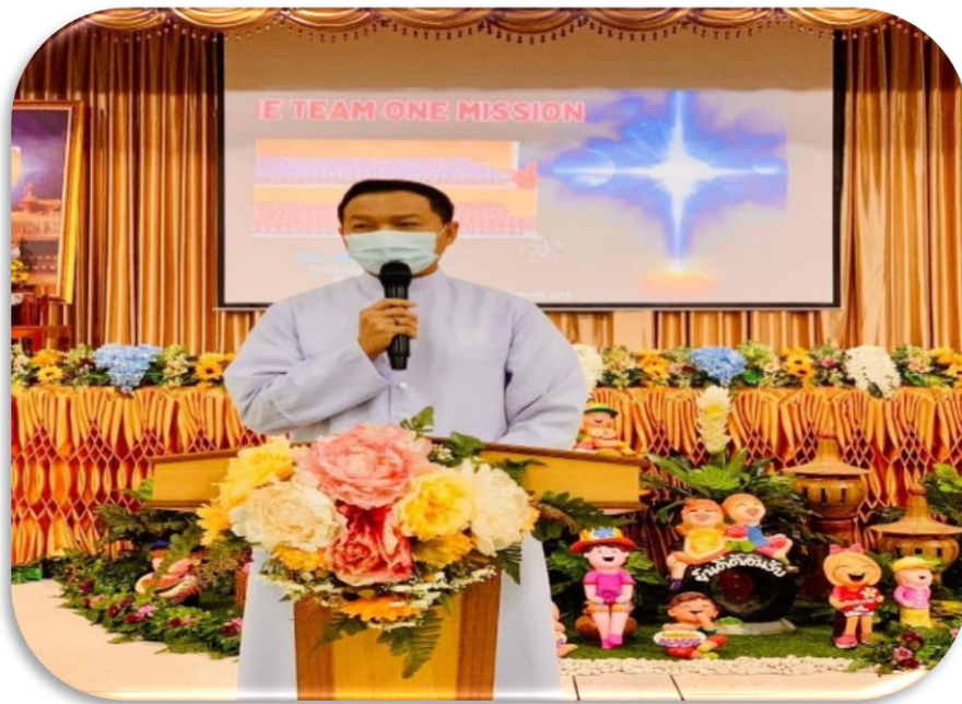
ประธานกล่าวเปิดการอบรมเชิงปฏิบัติการ “การทำงานเป็นทีม(One Team One Mission)”